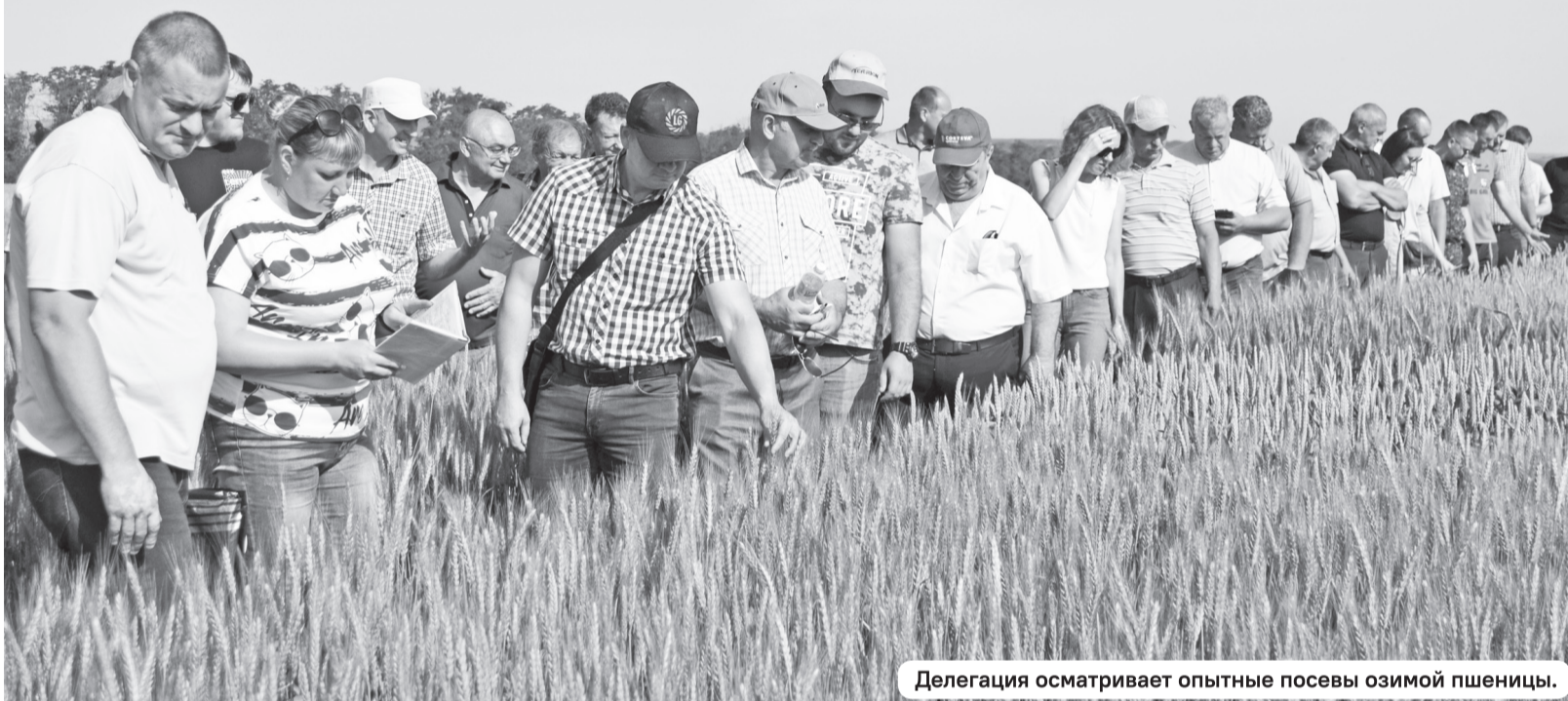
Делегация осматривает опытные посевы озимой пшеницы.

Нелёгкий труд хлеборобов оценивается жатвой. Тема уборки урожая остаётся центральной не только для аграриев, но и для большинства жителей нашего округа. В прошлую пятницу в течение всего дня проводился предуборочный объезд полей и животноводческих хозяйств.